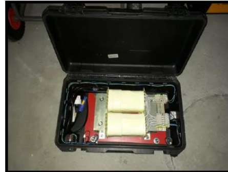
FUENTE DE PODER